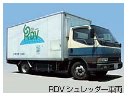
RDV シュレッダー車両